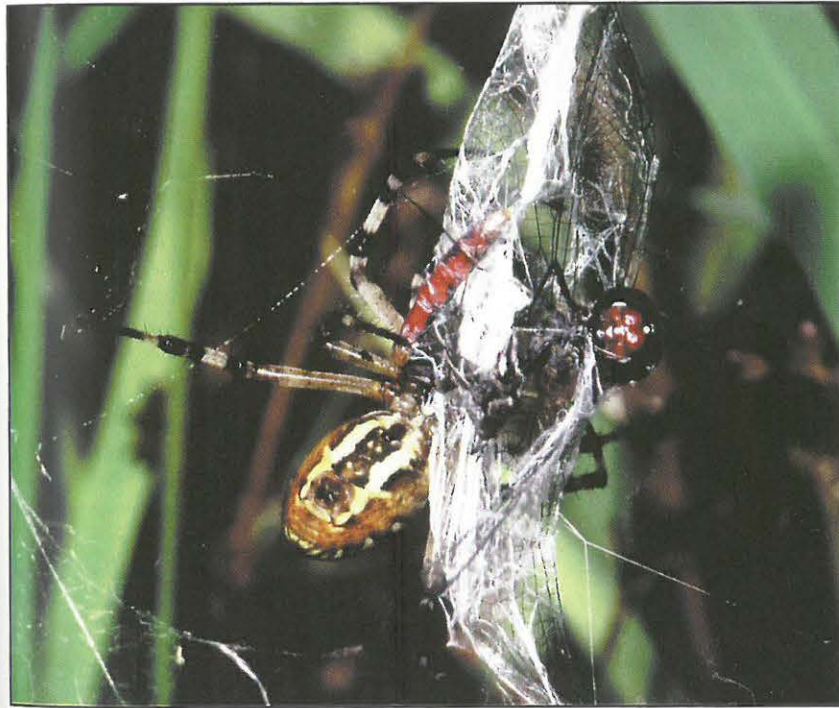
4 Eine Blutrote Heide-Iibelle ( Sympetrum sanguineum ) ist ins Netz geflogen und bereits eingesponnen. Die Wespenspinne sieht man von der Unterseite.

Nur so dürfte sich auch der erstaunlich schnelle „Eroberungsfeldzug“ der wärmeliebenden südeuropäischen Art aus dem Oberrheingraben zunächst östlich über ganz Süddeutschland und schließlich auch weiter nach Norden erklären. Daß die zu beobachtende Klimaerwärmung und allmähliche genetische Anpassung ihrerseits die Ausbreitung erst möglich gemacht haben, ist anzunehmen.