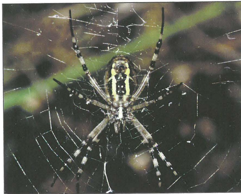
2 Unterseite eines erwachsenen Weibchens der Wespenspinne auf der Netznabe (Aufn. am Ufer des Scheuerteiches 20.8.1995)

wandten Arten auf einen Schlupfwinkel. Ihr Kopfbruststück setzt das silbrige Band des Stabiliments sozusagen noch ein Stückweit fort (Abb. 1). Wird die Spinne beunruhigt, versetzt sie das Netz in Schwingungen und verschmilzt so zusammen mit dem Stabiliment zu einem unscharfen Streifenmuster. Dieses Verhalten könnte im Verein mit der Körperzeichnung und dem Zickzackstabiliment der Tarnung und dem Schutz vor Freßfeinden, z.B. Vögeln dienen.