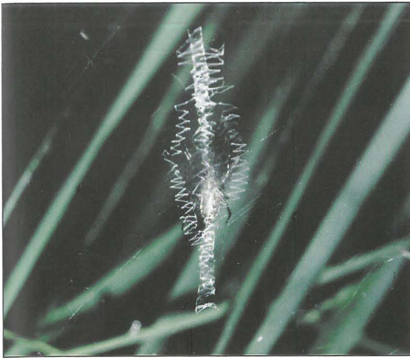
3 Ausführliches Stabiliment im Netz eines jüngeren, noch weniger auffällig gefärbten Weibchens der Wespenspinne; das Tier sitzt auf der abgewandten Seite des Netzes in der Achse des Stabiliments (Aufn. im Wollgrassumpf an der Altenrather Straße 3.7.1993)