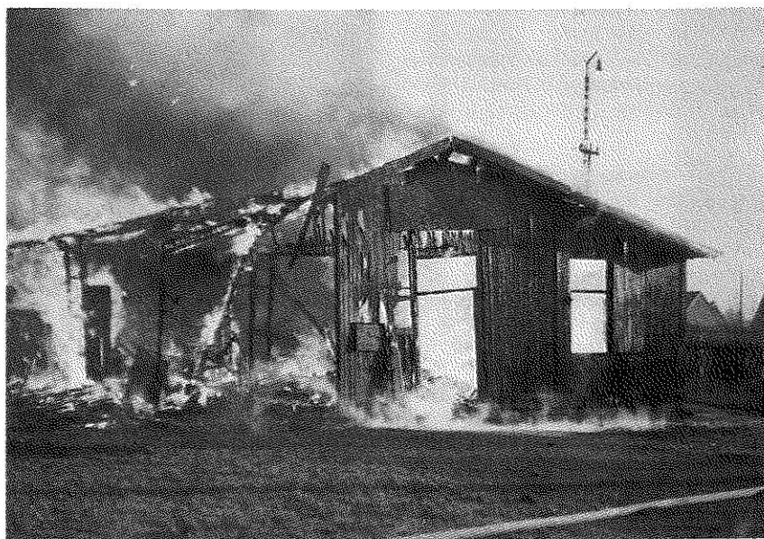
5 Als die Turnhalle an der Poststraße (heute steht hier die Troisdorfer Polizeistation) abbrannte, mußten die Aktivitäten des Eisenbahner-Sportvereins vorübergehend eingestellt werden.

unklaren darüber, ob es zusätzliche Organisationen in der Kategorie Freizeitverein gegeben hat. Das ist denkbar. 1988 registrierte die Stadt für Alt-Troisdorf den Schäferhundeverein Aggerdeich, den Tierschutzverein für den Rhein-Sieg-Kreis, den Kleingärtnerverein, den Briefftaubenliebhaberverein „Kehre wieder“, den Vogelschutz-, Kanarien- und Exotenzüchterverein Troisdorf und Umgebung und die Vogelfreunde Troisdorf und Umgebung. Dazu kommen zur Zeit noch einige Vereine, die in anderen Stadtteilen be-