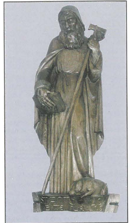
Hl. Antonius von 1941 - Bildhauer E. Schmitz, Köln

vom 25. März 1910. in dem der Antrag des Kirchenchores in allen Punkten genehmigt wurde, dazu konnte nach dem Hochamt noch der sakramentale Segen erteilt werden. Seitdem hat der Kirchenchor die Lizenz, an bei den Antonius-Festen zu singen.