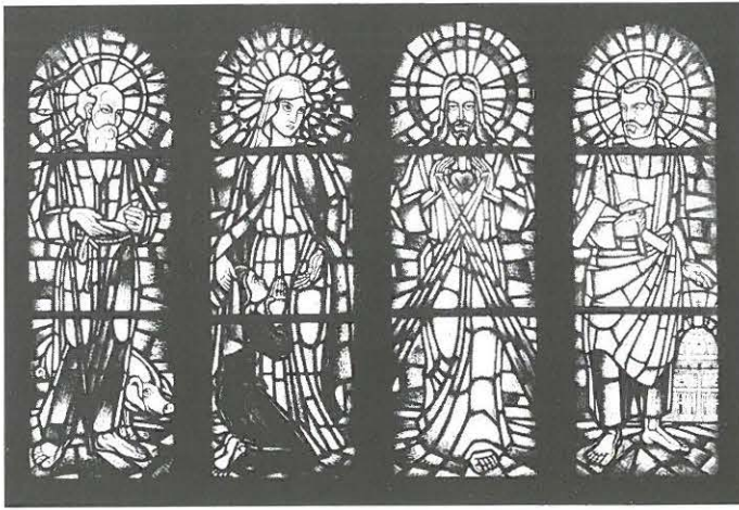
Kirchenfenster-Entwurf (Pape) von 1929

statue zu liefern für einen Preis, der für den guten Zweck an der untersten Grenze einer fünfstelligen Summe lag; allein der Versicherungswert ist bedeutend höher.