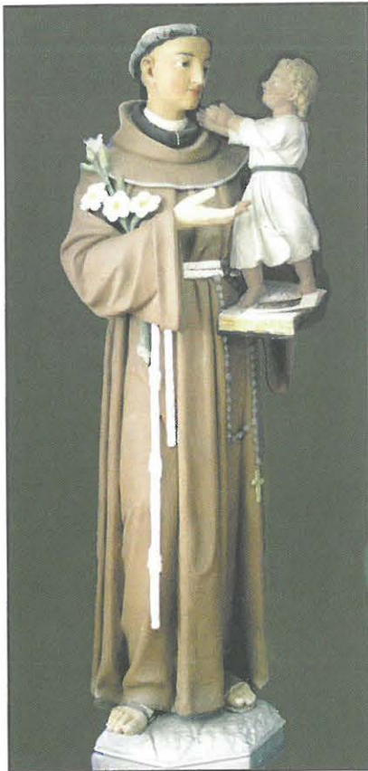
Original-Statue von 1908: Antonius von Padua - vom Sperrmüll von der Stifterfamilie wieder zurückgenommen