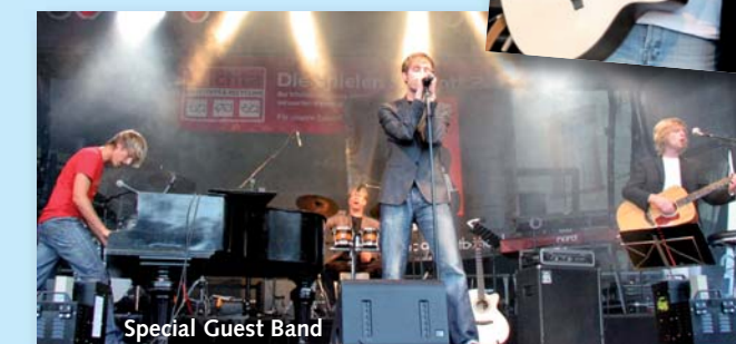
Special Guest Band