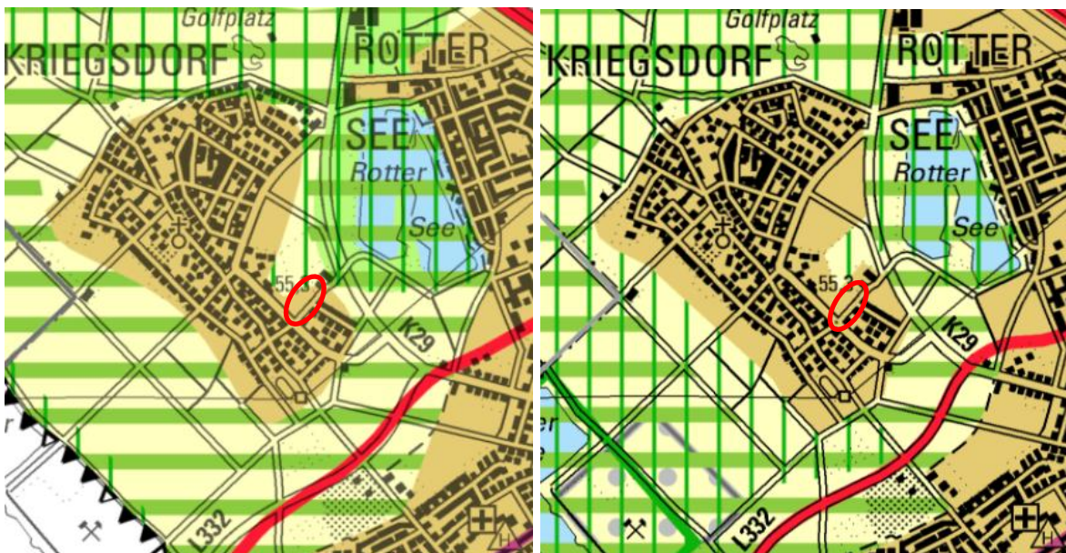
Abb. 1:links: Ausschnitt aus dem bis zum 29.10.2025 rechtsgültigen Regionalplan, rechts: Ausschnitt aus dem seit dem 29.10.2025 rechtsgültigen Regionalplan, jeweils rot umringelt das Plangebiet

Bei Aufstellung der Bauleitplanungen für den Bebauungsplan K 211 und der 10.Änderung des Flächennutzungsplans galt die Fassung des Regionalplans für den Regierungsbezirk Köln, Teilabschnitt Region Bonn/Rhein- Sieglar wie oben links dargestellt. Seit dem 29.10.2025 ist nun der neu aufgestellte Regionalplan rechtsgültig (Abb.1: rechts).