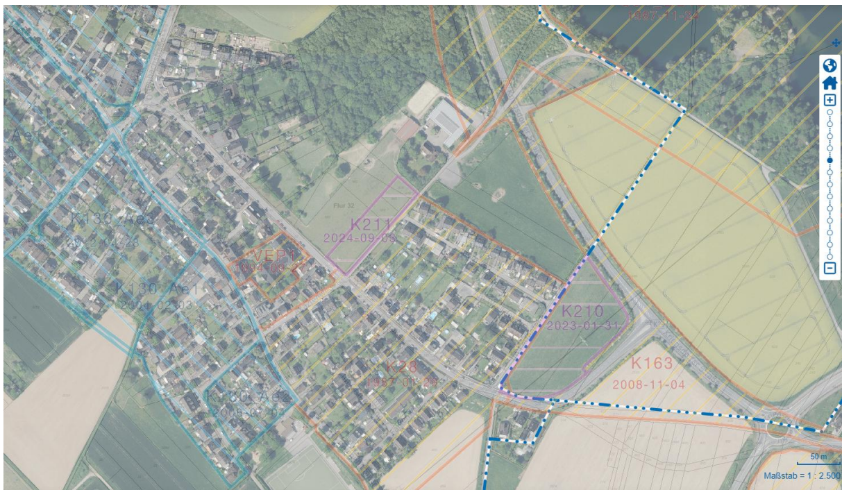
Abb. 1 Luftbild und Darstellung der Geltungsbereiche von rechtskräftigen (orange und blau umrandet) und in Aufstellung (magentafarben umrandet) befindlichen Bebauungsplänen

Das ca. 4360 m 2 Plangebiet befindet sich im südöstlich Bereich von Kriegsdorf. Aktuell wird die unbebaute Fläche in den Sommermonaten als Weide für die nicht gewerblich gehaltenen Galloway Rinder des Engeshofs genutzt. Die Fläche befindet sich im sog. Außenbereich gem. § 35 BauGB.