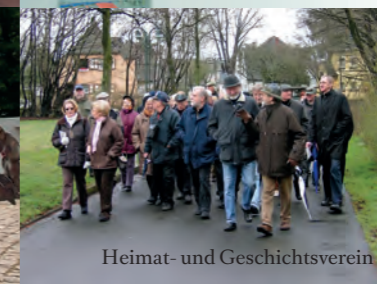
Heimat- und Geschichtsverein