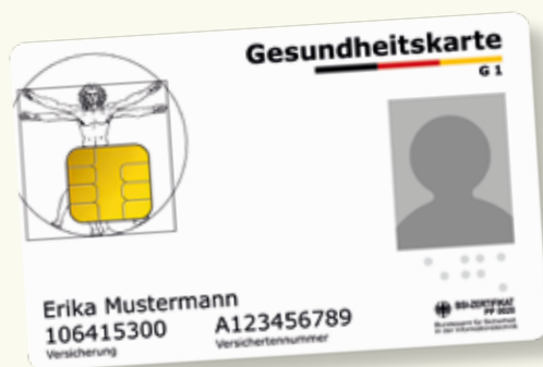
Uzorak zdravstvene kartice

Uvijek ponesite sa sobom svoju elektronsku zdravstvenu karticu kada koristite zdravstvene usluge. Od 1. januara/siječnja 2015. god. ova kartica važi/vrijedi kao isključivi dokaz prava na usluge iz ob(a)veznog zdravstvenog osiguranja. Na elektronskoj zdravstvenoj kartici memorisani/pohranjeni su vaše ime i prezime, datum rođenja i adresa, kao i broj vašeg zdravstvenog osiguranja i vaš osiguranički status (osiguranik, član porodice/obitelji ili penzioner/umirovljenik) kao ob(a)vezni podaci. Osim toga, elektronska zdravstvena kartica sadrži i vašu sliku.