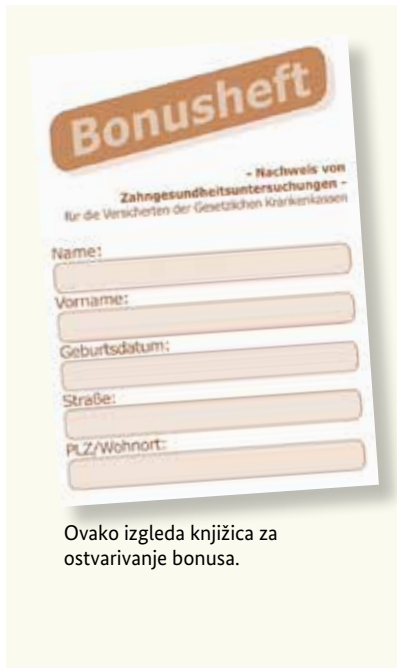
Ovako izgleda knjižica za ostvarivanje bonusa.

Zdravi zubi su sastavni dio kvalitetnog života. Zato su važni redovni preventivni pregledi – čak i ako nemate nikakvih problema sa zubima. Fondovi/Zavodi ob(a)veznog zdravstvenog osiguranja plaćaju i troškove ovih preventivnih pregleda. Ovi pregledi pomažu da se određena oboljenja otkriju na vrijeme i liječe. Za te preglede dobit ćete od svog fonda/zavoda takozvanu „Knjižicu za ostvarivanje bonusa (Bonusheft)“. U ovu knjižicu upisuju se preventivni pregledi. Ako možete da dokažete da ste najmanje jednom godišnje (za osobe mlađe od 18 godina, najmanje jednom u pola godine) bili kod zubara, fond/zavod (Krankenkasse) plaća veći dodatak u slučaju ugradnje vještačkih zuba.