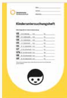
Ovako izgleda knjižica pregleda kod djece (U-Heft).

Ovi pregledi su veoma važni. Zato vas molimo da odete na sve ove preglede i uvijek ponesite sa sobom knjižicu za upisivanje pregleda („U-Heft“), kao i vakcinalni karton/knjižicu cijepljenja svog djeteta. Ovi pregledi su u službi zdravlja vašeg djeteta.