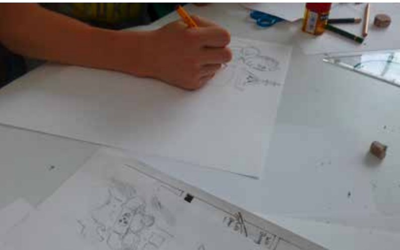
Abb. Links: Workshop auf der Burg Wissem, Foto: Jennifer Walther - Hammel

Das Angebot ist kostenfrei. Für Kinder jeden Alters, mit Jennifer Walther - Hammel