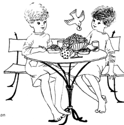
Abb. Ilon Wikland, Illustration zu »Mio, mein Mio«, 1954