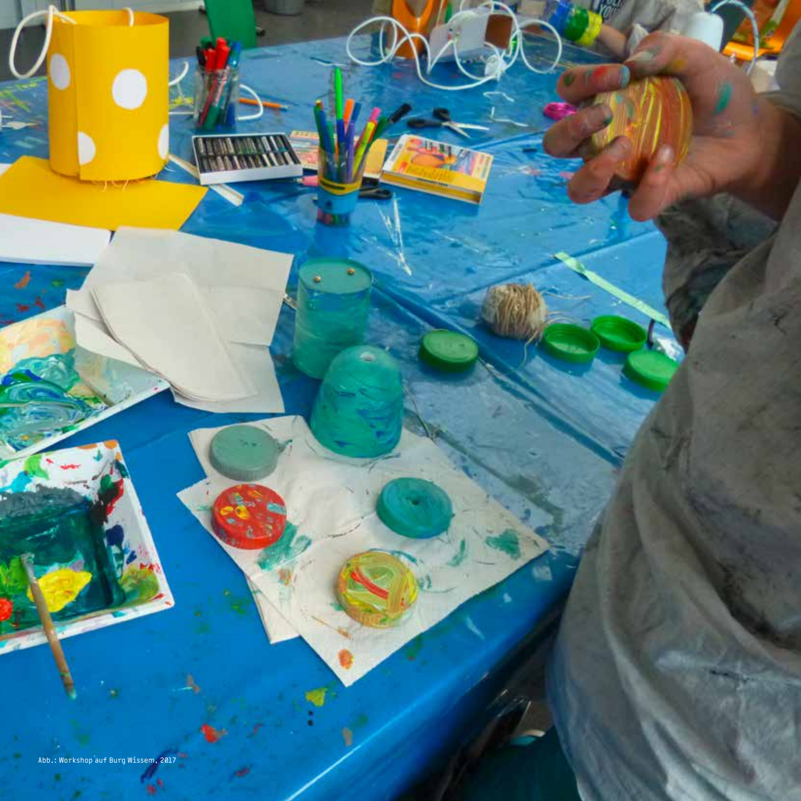
Abb.: Workshop auf Burg Wissem, 2017