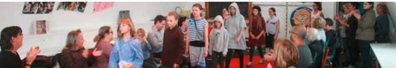
Abb.: Fashion Days auf Burg Wissem, 2017

Veranstalter: MUSIT, Heimat- und Geschichtsverein Troisdorf, Heinz-Müller-Stiftung, Portal Wahner Heide. Die Veranstaltung ist kostenfrei. Anmeldung unter: Tel.: 02241/900-456, Maximal 30 Teilnehmer/innen, Treffpunkt: Raum Wahner Heide, Burg Wissem