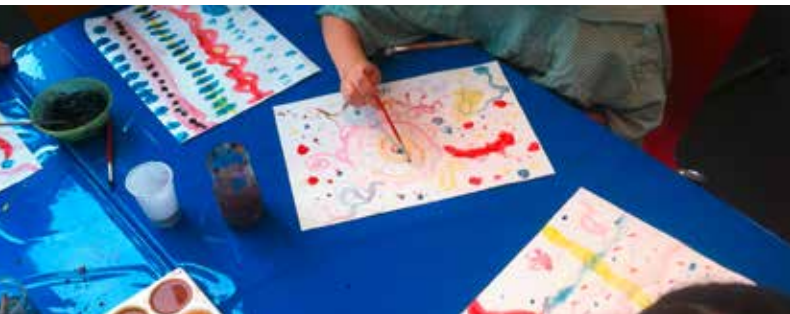
Abb.: Workshop auf Burg Wissem

Sonntag, 12.08. u. Sonntag, 16.09.2018, jeweils 14-17 Uhr