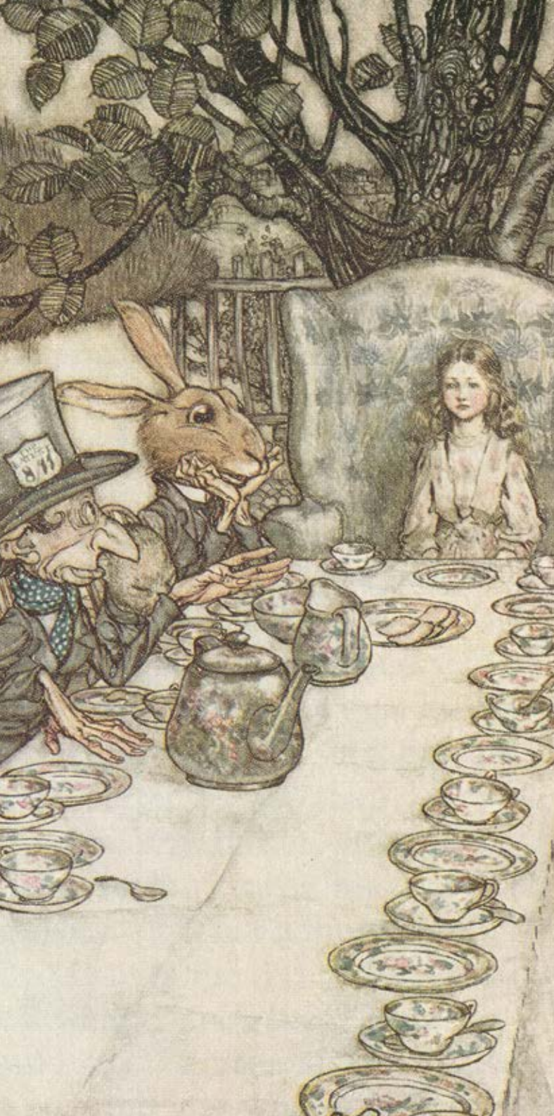
Abb.: Arthur Rackham, Illustration zum Buch »Alice's Adventures in Wonderland« (Text: Lewis Carroll), William Heinemann (London) 1917

Mit der geplanten Ausstellung »Alice im Wunderland – Eine Wunderwelt im Bilderbuchmuseum Troisdorf« gibt das Bilderbuchmuseum Troisdorf zum ersten Mal die Spannweite der Gestaltung und Interpretationen eines der berühmtesten klassisch-literarischen Werke der Bilder- und Kinderbuchszene wieder. Hierbei wurden möglichst vielseitige Bild- und Buchausleihen zusammengeführt, um so einen umfangreichen Einblick in die sehr unterschiedliche Bilderbuchproduktion von »Alice im Wunderland« zu erhalten. Bücher und Bilder stehen in Bezug zu zahlreichen Mitmachstationen. Diese ergänzen die Exponate sinnvoll, zugleich dienen sie aber auch dazu, vor allem die Kinder kreativ und eigenständig in die skurrile Phantasie des Romans einzuführen.