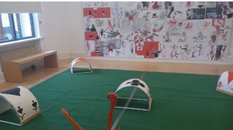
Abb.: Einblick in die Ausstellung »Alice im WunderLand«

Kostenbeitrag: Festpreis für bis zu 10 Kinder 50 Euro, für jedes weitere Kind zusätzlich 2,50 Euro. Weitere Informationen und Anmeldung unter Tel.: 02241/8841-447 oder 02241/900-456