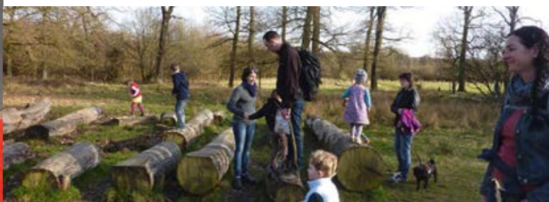
Abb. rechts: Familienwanderung in der Wanner Heide

Abb. links: Workshop auf der Burg Wissem